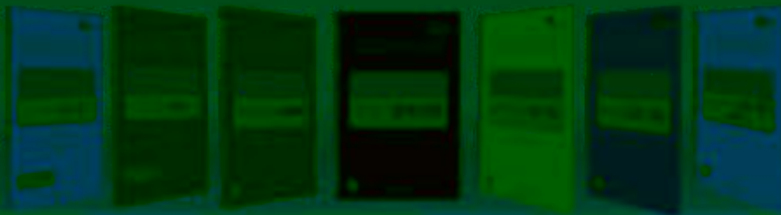
英语 日语 韩语 法语 德语 俄语 西班牙语 葡萄牙语